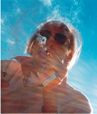
um 1990 DLA MARBACH

Eine Edition der Arno Schmidt Stiftung in Zusammenarbeit mit dem Deutschen Literaturarchiv Marbach am Neckar