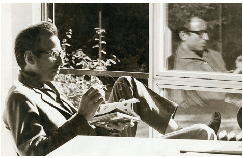
um 1960